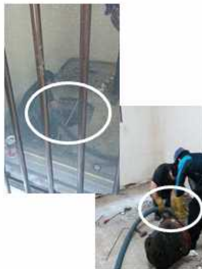
가정집 방 안에 정화조가 있습니다.