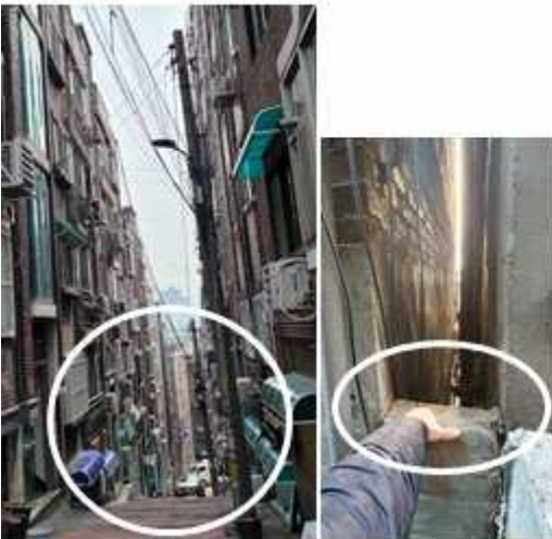
좁은 골목길, 빌라 간격은 한 뼘. 소방차출입불가.