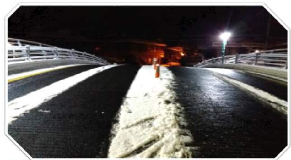
강설에도 완벽하게 관리되고 있는 도로 상황[인용]