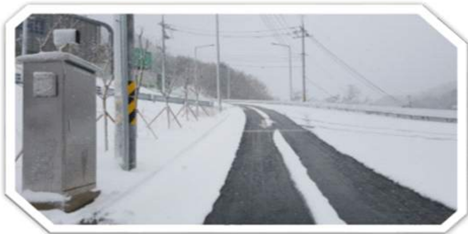
재난관리실에서 관리되는 인공지능 센서와 도로 사진[인용]