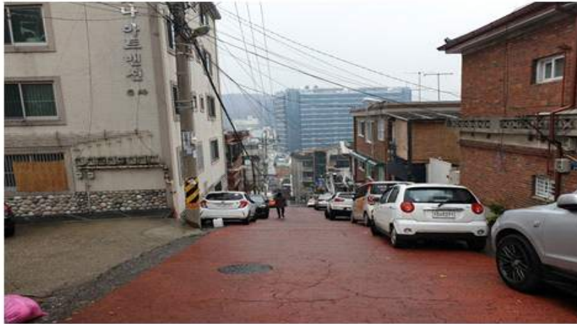
아찔한 원도심 뒷골목의 급경사 실태와 자료 사진