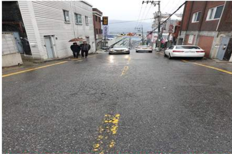
박석로에 인도가 없어 보행인이 차도를 걷고 있음