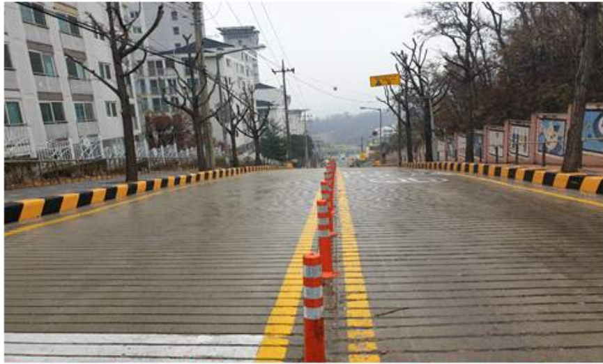
태평로 도로 열선시공 후 주변 환경과 어울리는 자료사진