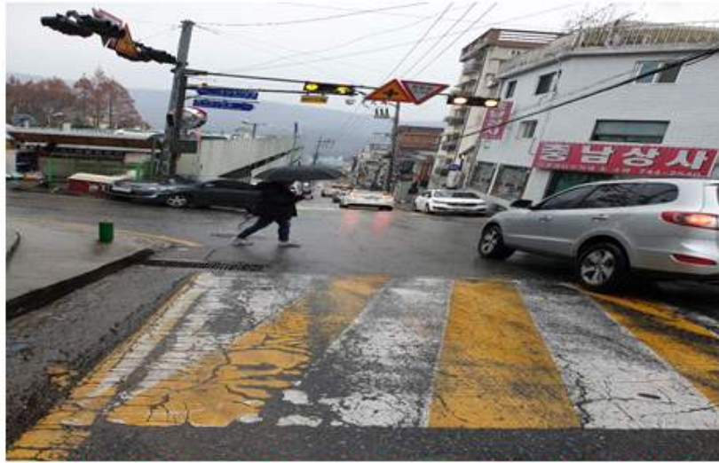
박석로 중원초등학교 건널목 인근 실태 자료사진