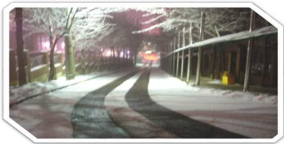
도로 열선 시공으로 관리되는 서울시의 도로(인용)