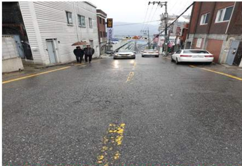
박석로에 인도가 없어 보행인이 차도를 걷고 있음