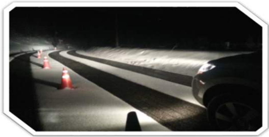
열선시공으로 완벽하게 관리되는 강원도 도로 사진[인용]