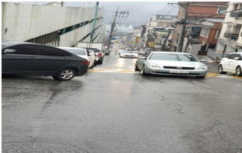
박석로 조립식 공영주차장 방면 도로 자료사진