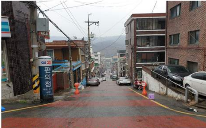
위험한 원도심의 뒷골목 실태와 자료사진