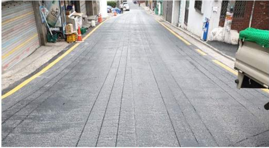
서울시 강북구의 시공 완료를 앞둔 도로포장 용설시스템 현장