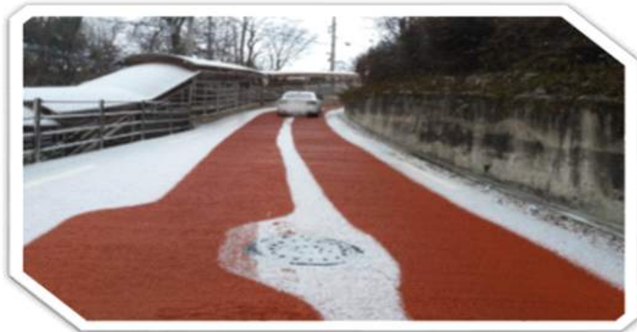
서울시 성북구의 강설에도 제대로 관리되는 용설시스템[인용]