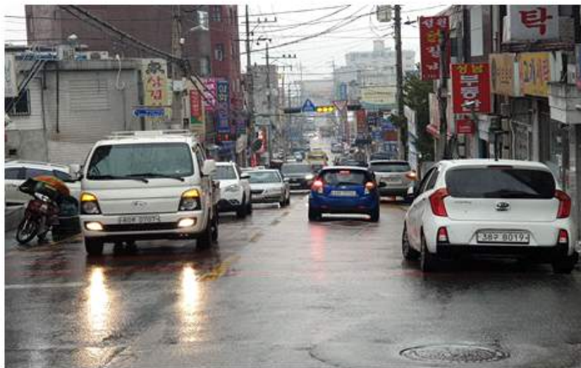
박석로 상대원3동 행정센터 앞 도로 실태와 자료 사진